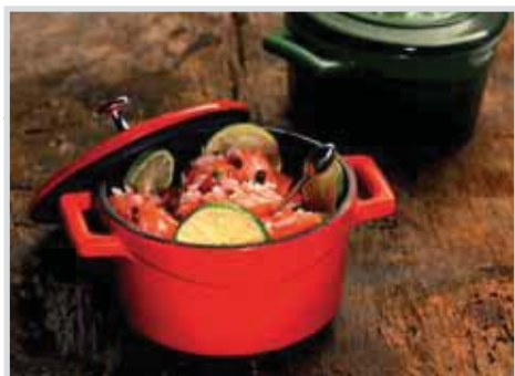
Casseruola tonda Saucepot round Fleischtopf, rund Brasière Cacerola redonda