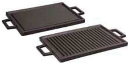
Griglia reversibile Griddle plate, dual side, reversible Grill-Platte, zweiseitig, reversible Gril rectangle, reversible Parrilla reversible