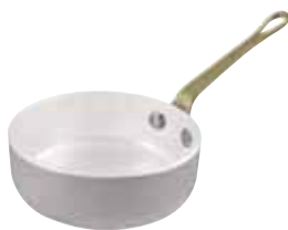
Casseruola bassa Sauté pan Stielkasserole, niedrig Plat à sauter Cazo recto bajo