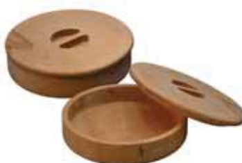
Ciotola tortillas, legno Tortillas cup, wood Tortillas-Schale, Holz Coupe-tortillas, bois Copa tortillas, madera

Ciotoline non incluse. - Cups not included.