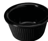
Coppa salsa melamina Sauce bowl, melamine Saucentasse, Melamin Bol à sauce, melamine Copa para salsa, melamine