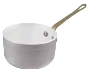
Casseruola alta Saucepan Stielkasserole, hoch Casserole haute Cazo recto alto