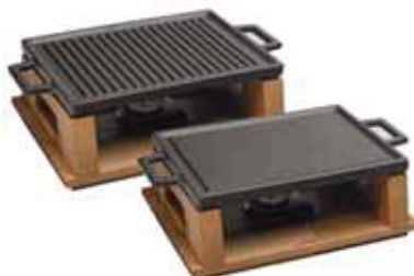
Barbecue da tavola Hot plate and wooden service platter Grill-Platte mit Service-Holzbrett Gril avec plache à servir bois Grill con tabla madera