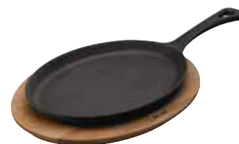
Piatto fajita con supporto legno Fajita plate with wooden platter Fajitaplatte mit Holzbrett Plat à fajitas avec planche bois Fuente fajitas con tabla madera