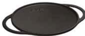
Piatto pizza Pizza pan Pizza-Platte Plat à pizza Fuente para pizza