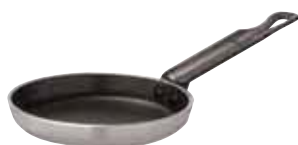
Padella blini, alluminio antiaderente Blinis non-stick aluminum pan Blinis-Alupfännchen, nichtaftend Poêle à blinis, alu anti-adhérente Sartén blinis, antiadherente

Corpo in alluminio con rivestimento antiaderente, manicatura in ottone. - Aluminum body non-stick coated, brass handles.