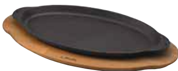
Piatto pesce con supporto legno Fish plate with wooden platter Fischplatte mit Holzbrett Plat à poisson avec planche bois Fuente pescado con tabla madera