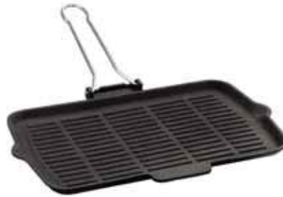
Bistecchiera Grill pan Grill-Pfanne Poêle grill Sartén grill