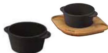
Coppa soufflè Soufflé pot Ramekin Ramequin Fuente soufflè