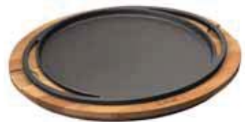
Piatto pizza con supporto legno Pizza pan with wooden platter Pizza-Platte mit Holzbrett Plat à pizza avec planche bois Fuente para pizza con tabla madera