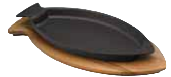
Piatto pesce con supporto legno Fish plate with wooden platter Fischplatte mit Holzbrett Plat à poisson avec planche bois Bandeja pescado con tabla madera