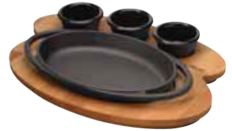
Piatto ovale con supporto legno Oval plate with wooden platter Platte mit Holzbrett, oval Plat oval avec planche bois Fuente ovale con tabla madera