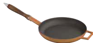
Padella manico legno Frypan wooden handle Bratpfanne mit Holz-Griff Poêle manche bois Sartén mango madera