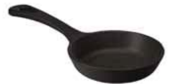
Padella tonda Round pan Pfanne, rund Poêle ronde Sartén grill redonda