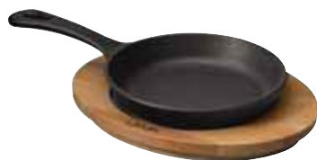
Padella tonda con supporto legno Round pan and wooden platter Pfanne, rund mit Holzbrett Poêle ronde avec planche bois Sartén grill redonda con tabla madera