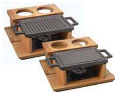
Barbecue da tavola Hot plate and wooden service platter Grill-Platte mit Service-Holzbrett Gril avec plache à servir bois Grill con tabla madera