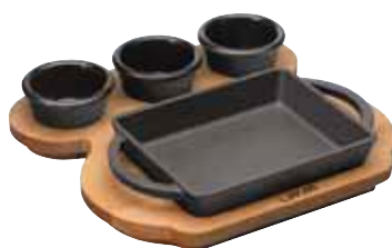
Tegame con supporto a servire legno Rectangular pan with wooden service stand Pfanne mit Service-Holzbrett Poêle avec support à servir bois Sartén con tabla madera