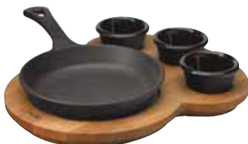
Padella tonda con supporto legno Round pan and wooden platter Pfanne, rund mit Holzbrett Poêle ronde avec planche bois Sartén grill redonda con tabla madera