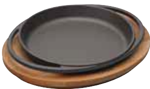
Piatto tondo con supporto legno Round plate with wooden platter Platte mit Holzbrett, rund Plat rond avec planche bois Fuente redonda con tabla madera