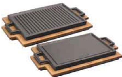
Griglia con supporto legno Griddle with wooden platter Grill-Platte mit Holzbrett Gril rectangle avec planche bois Grill con tabla madera

Ciotoline non include. - Cups not included.