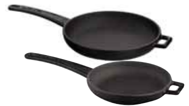
Padella Frypan Bratpfanne Poêle Sartén