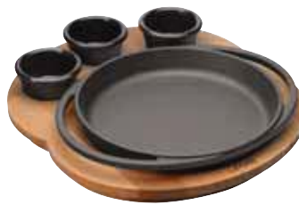
Piatto tondo con supporto legno Round plate with wooden platter Platte mit Holzbrett, rund Plat rond avec planche bois Fuente redonda con tabla madera