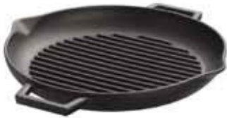
Padella grill Grill pan Grill-Pfanne Poêle grill Sartén grill