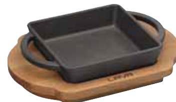
Tegame con supporto a servire legno Rectangular pan with wooden service stand Pfanne mit Service-Holzbrett Poêle avec support à servir bois Sartén con tabla madera

Ciotoline non incluse. - Cups not included.