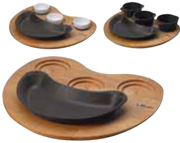
Piatto fajita con supporto legno Fajita plate with wooden platter Fajitaplatte mit Holzbrett Plat à fajitas avec planche bois Fuente fajitas con tabla madera