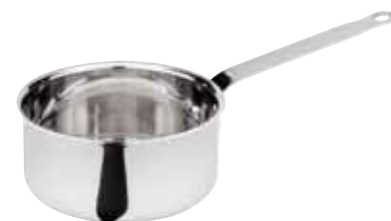
Casseruola bassa, 3-ply Sauté pan Stielkasserolle, niedrig Plat à sauter Cazo recto bajo