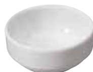
Coppa salsa, porcellana Sauce bowl, porcelain Saucentasse, Porzellan Bol à sauce, porcelaine Copa para salsa, porcelana