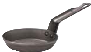
Padella blini, ferro Blinis steel frypan Blinis-Eisenpfännchen Poêle à blinis, acier Sartén blinis, hierro