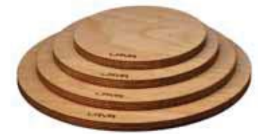
Sottopentola legno, magnetico Wooden platter with magnetic feature Holzbrett, magnetisch Planche en bois, magnétique Tabla madera magnética