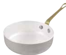
Padella Frypan Bratpfanne Poêle à frirer Sartén