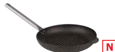
Padella grill manico inox Grill pan stainless steel handle Grill-Pfanne mit Edelstahl-Griff Poêle grill manche inox Sartén grill mango inox