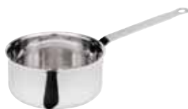
Casseruola bassa, 3-ply Sauté pan Stielkasserolle, niedrig Plat à sauter Cazo recto bajo