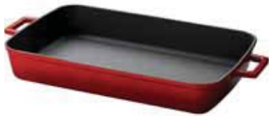
Tegame rettangolare Bake roasting dish Pfanne, rechteckig Plat rectangulaire Rustidera