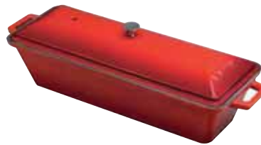
Terrina Terrine pot Pasteten-Pfanne Terrine rectangle Fuente rectangular