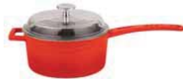
Casseruola alta con coperchio vetro Saucepan with glass lid Stielkasserolle, hoch mit Glasdeckel Casserole haute avec couvercle verre Cazo recto alto con tapa vidrio