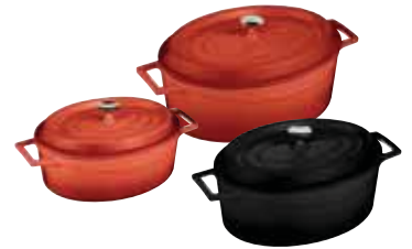
Casseruola ovale Oval saucepan Ovaler Bratentopf Casserole ovale Cacerola oval