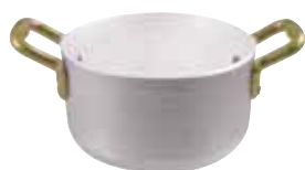
Casseruola alta Saucepan Fleischtopf Casserole haute Cazo recto alto