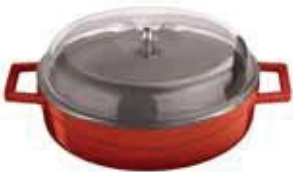
Casseruola bassa coperchio vetro Casserole pot with glass lid Bratentopf mit Glasdeckel Sautoir avec couvercle verre Cacerola baja con tapa vidrio