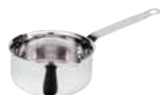
Casseruola con due becchi, 3-ply Sauté pan with double spouts Stielkasserolle, niedrig, 2 Schnabel Plat à sauter, 2 becs Cazo recto bajo, 2 picos