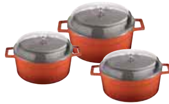
Casseruola alta coperchio vetro Saucepot with glass lid Fleischtopf mit Glasdeckel Brasière avec couvercle verre Cacerola alta con tapa vidrio