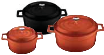
Casseruola alta Saucepot Fleischtopf Brasière Cacerola alta