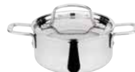
Casseruola con coperchio, 3-ply Saucepot with lid Fleischtopf mit Deckel Brasière avec couvercle Cacerola alta con tapa