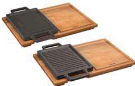
Griglia reversibile con tagliere a servire legno Grill plate and wooden service platter Grill-Platte mit Service-Holzbrett Gril avec plache à servir bois Grill con tabla madera