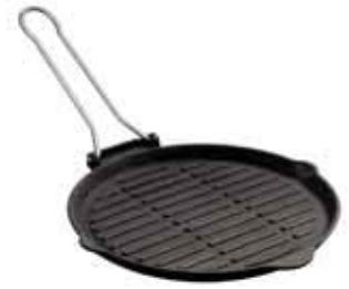
Bistecchiera Grill pan Grill-Pfanne Poêle grill Sartén grill