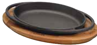
Piatto ovale con supporto legno Oval plate with wooden platter Ovalplatte mit Holzbrett Plat oval avec planche bois Fuente ovale con tabla madera