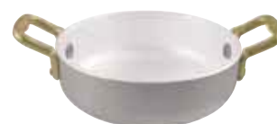
Tegamino French omelet pan Pfanne Poêle à paella Paellera