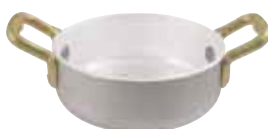
Casseruola bassa Casserole pot Bratentopf Sautoir Cacerola baja