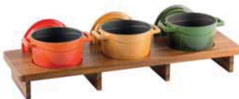
Supporto legno Wooden Stand Holz-Träger Support en bois Soporte de madera