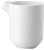
Creamer Gießler Lattiera Crémier

14440 Ø 7 cm H 9 cm 0,15L Ø 2 ¾ in. H 3 ½ in. 5 ¼ oz.