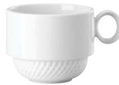
Cup, stackable Obertasse, stapelbar Tazza impilabile Tasse empilable

14776 Ø 8,5 cm H 7 cm 0,25L Ø 3 ⅜ in. H 2 ¾ in. 8 ½ oz.