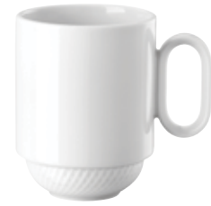
Mug with handle stackable Becher mit Henkel stapelbar Mug con manico impilabile Gobelet avec anse empilable

15491 Ø 8,5 cm H 11 cm 0,40 L Ø 3 ⅜ in. H 4 ⅓ in. 13 ½ oz.