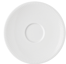
Saucer Untertasse Piattino Soucoupe

14776 Ø 8,5 cm H 7 cm 0,25L Ø 3 ⅜ in. H 2 ¾ in. 8 ½ oz.