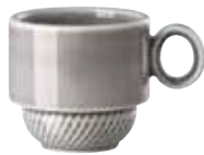
Cup, stackable Obertasse, stapelbar Tazza impilabile Tasse empilable

16727 Ø 6 cm H 6 cm 0,10L Ø 2 ⅜ in. H 2 ¾ in. 3 ⅜ oz.