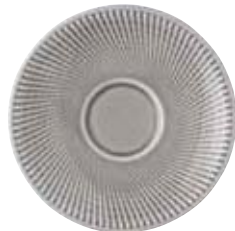
Saucer Untertasse Piattino Soucoupe

16727 Ø 6 cm H 6 cm 0,10L Ø 2 ⅜ in. H 2 ¾ in. 3 ⅜ oz.