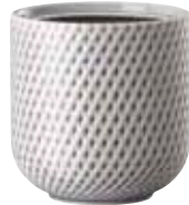
Sugar bowl Zuckerdose Zuccheriera Sucrier

14440 Ø 7 cm H 9 cm 0,15L Ø 2 ¾ in. H 3 ½ in. 5 ¼ oz.