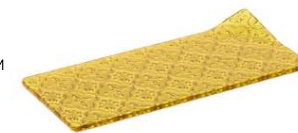
Base Cristal M Glass Dish Amber M Assiette En Verre M Piatto In Vetro M Glasteller M