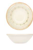
Bol Bowl Bol Ciotola Schale