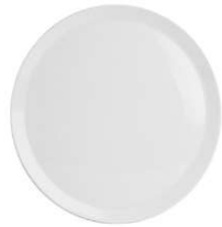
Plato Pizza Pizza Plate Assiette à Pizza Piatto Pizza PizzaTeller