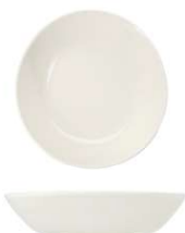
Plato Hondo Deep Plate Assiette Creuse Piatto Fondo Teller Tief