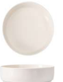
Bol Bowl Bol Ciotola Schale