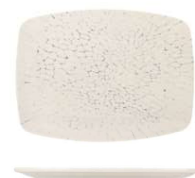
Bandeja Tray Plateau Vassoio Tablett