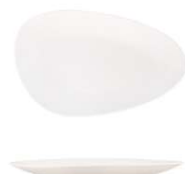
Plato Ovalado Oval Plate Assiette Ovale Piatto Ovale Ovaler Teller