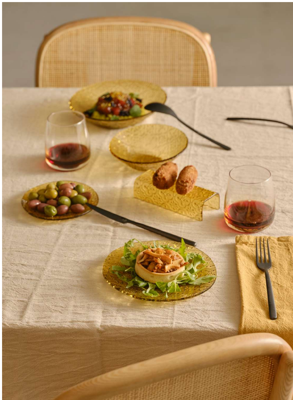
Bol cristal Glass bowl Bol en verre Ciotola in vetro Kristallkugel