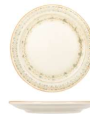
Plato Llano Coupé Coupe Flat Plate Assiette Plate Coupe Piatto Piano Coupe Coupe-Flacher Teller