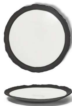
Plato llano coupé Coupe fiat plate Assiette plate coupe Piatto piano coupe Coupe-flacher teller