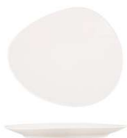
Plato Llano Coupé Coupe Flat Plate Assiette Plate Coupe Piatto Piano Coupe Coupe-Flacher Teller