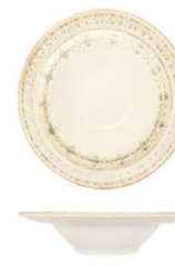
Plato pasta Bowl Bol Ciotola Schale