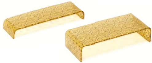
Soporte Snacks Cristal rectangular Glass Oblong Snack Stand Support En-Cas En Verre Rectangulaire Supporto Snacks In Vetro rettangolare Snack-Theke Glas Rechteckig