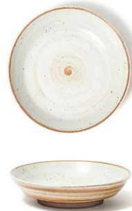
Plato hondo Deep plate Assiette creuse Piatto fondo Teller tief