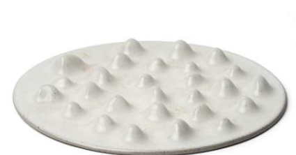
Plato rocks aa Rocks plate Assiette roches Piatto rocce Felsenteller