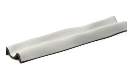
Teja wave Limits Wave tile Assiette Tuile ondulé Tegola ondulata Bernstein