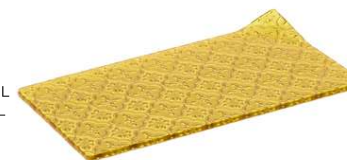
Base Cristal L Glass Dish Amber L Assiette En Verre L Piatto In Vetro L Glasteller L