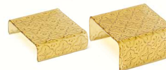
Soporte Snacks Cristal Cuadrado Glass Square Snack Stand Support En-Cas En Verre Supporto Snacks In Vetro Basso Snack-Theke Glas