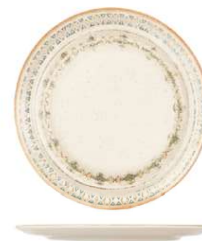
Plato pizza Pizza Plate Assiette à Pizza Piatto Pizza PizzaTeller