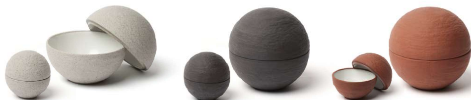
Plato esfera Spherical plate Assiette sphérique Piatto sferico Kugelförmiger Teller