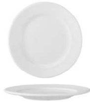
Plato Llano Flat Plate Assiette Plate Piatto Piano Flacher Teller