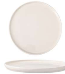
Plato Llano Flat Plate Assiette Plate Piatto Piano Flacher Teller