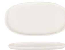
Plato Ovalado Oval Plate Assiette Ovale Piatto Ovale Ovaler Teller