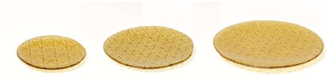
Plato Tiro Cristal Redondo Glass Plate Round Assiette Resto En Verre Ronde Piatto Tiro In Vetro Rotondo Runder Gasteller Tiro