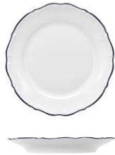
Plato Llano Coupé Coupe Flat Plate Assiette Plate Coupe Piatto Piano Coupe Coupe-Flacher Teller