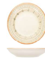
Plato Hondo Coupé Deep Plate Assiette Creuse Piatto Fondo Teller Tief