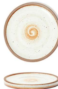
Plato llano Flat plate Assiette plate Piatto piano Flacher teller