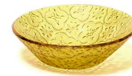
Bol cristal Glass bowl Bol en verre Ciotola in vetro Kristallkugel