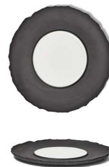
Plato llano Flat plate Assiette plate Piatto piano Flacher teller