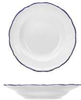
Plato Hondo Deep Plate Assiette Creuse Piatto Fondo Teller Tief