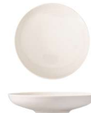
Plato Hondo Coupé Coupé Deep Plate Assiette Creuse Coupé Piatto Piano Coupé Coupe-Tief Teller