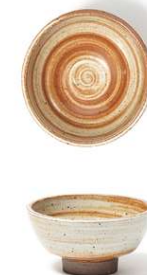
Bol Bowl Bol Ciotola Schale