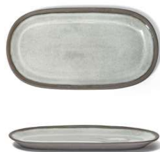
Plato llano coupé Coupe flat plate Assiette plate coupe Piatto piano coupe Coupe-flacher teller