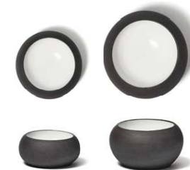
Peana redonda Round base Base ronde Base rotonda Runder sockel