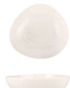
Plato Hondo Deep Plate Assiette Creuse Piatto Fondo Teller Tief