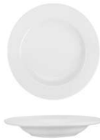
Plato Hondo Deep Plate Assiette Creuse Piatto Fondo Teller Tief