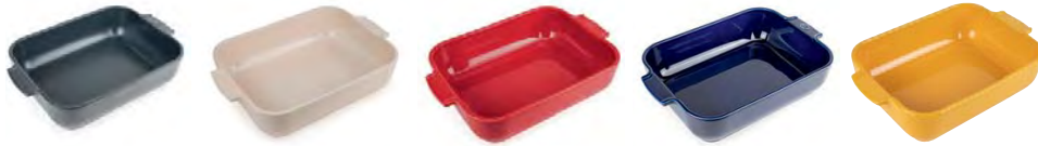
SLATE 36 cm - 44701S36 ECRU 36 cm - 44701C36 RED 36 cm - 44701R36 BLUE 36 cm - 44701B36 SAFFRON YELLOW 36 cm - 44701Y36