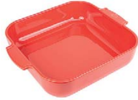
Square baker RED Pirofila quadra Quadratische Ofenschale Plat four carré Plato horno cuadrado