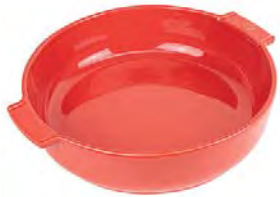
Round baker RED Pirofila tonda Runde Ofenschale Plat four rond Plato horno redondo