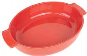
Oval baker RED Pirofila ovale Ovale Ofenschale Plat four ovale Plato horno ovalado