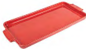
Tray RED Vassoio Tablett Plateau Bandeja