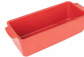
Rectangular baker RED Pirofila rettangolare Rechteckige Ofenschale Plat four rectangulaire Plato horno rectangular