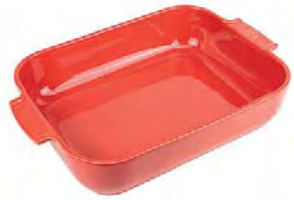
Rectangular baker RED Pirofila rettangolare Rechteckige Ofenschale Plat four rectangulaire Plato horno rectangular