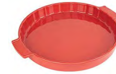
Round baker RED Pirofila tonda Runde Ofenschale Plat four rond Plato horno redondo