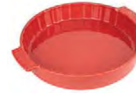
Round baker RED Pirofila tonda Runde Ofenschale Plat four rond Plato horno redondo