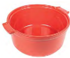
Soufflé dish RED Pirofila soufflé Soufflé Ofenschale Plat four soufflé Plato horno soufflé