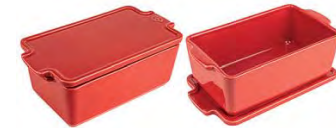
Terrine dish with lid RED Terrina con coperchio Terrine mit Deckel Terrine avec couvercle Plato horno pan con tapa